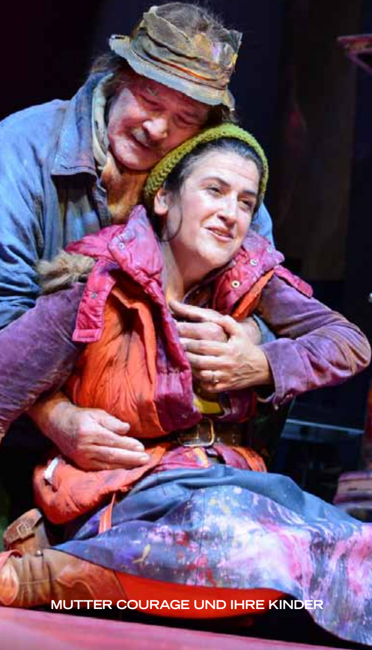
MUTTER COURAGE UND IHRE KINDER