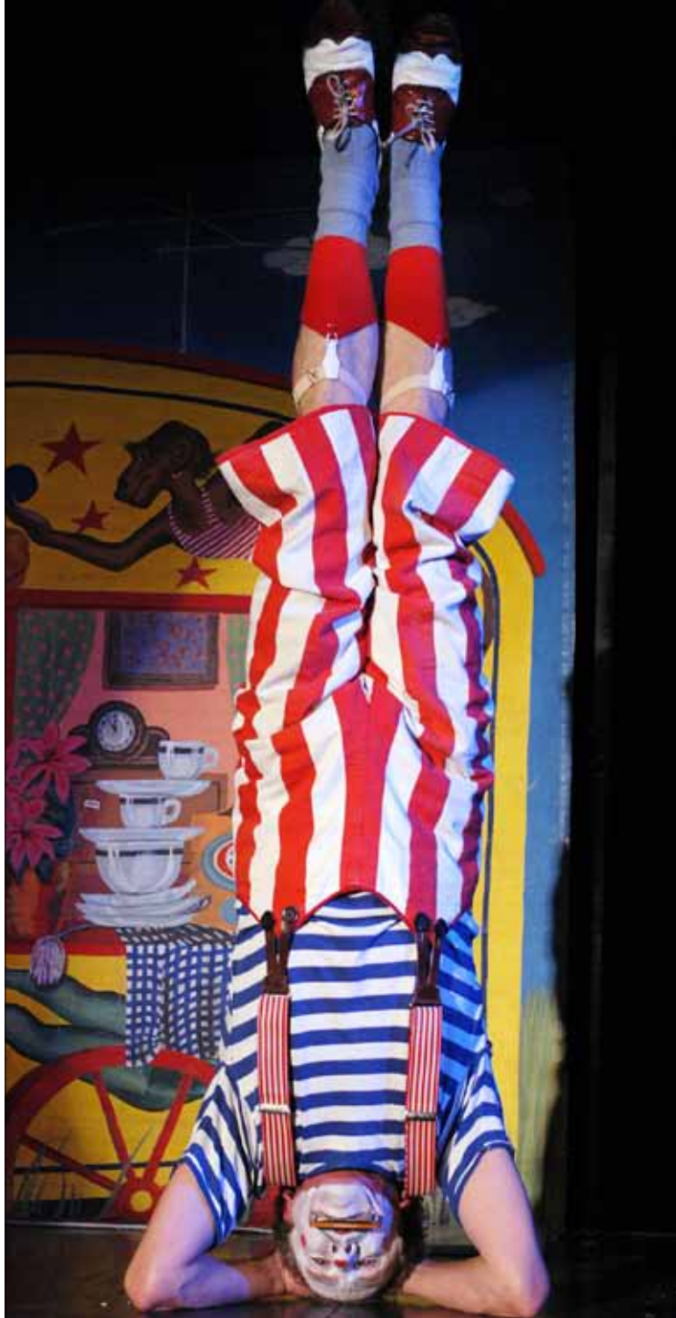
THE CLOWN WHO LOST HIS CIRCUS

DO / 8.6. / 10:00 Tickets: 10,- € / 8,- € / 6,50 € (Schüler) / 20,- € (Familienticket) / 5,- € (Schülergruppen) / 3,50 € (Frühbucher)